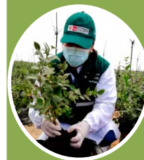
Sanidad, investigación, tecnología, etc.