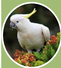
Flora y Fauna