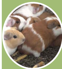
Cultivos y crianzas